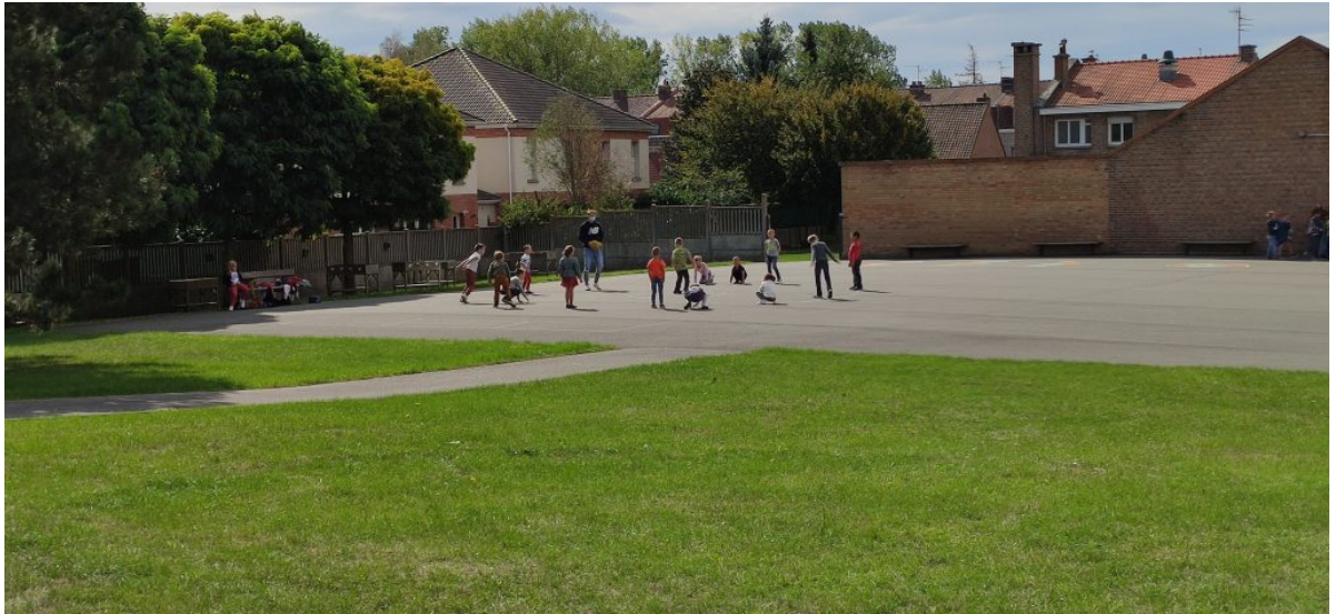
Jeux de groupe